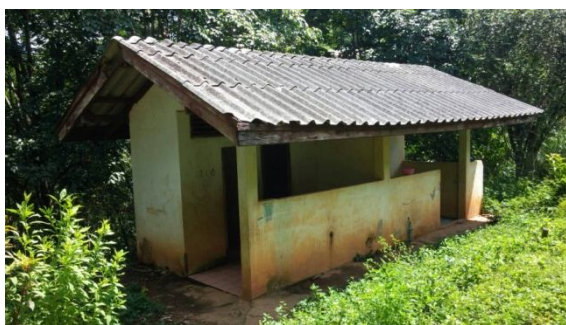
ห้องสุขาหลังเก่าทรุดโทรม

โรงเรียนบ้านไทยสมบูรณ์ อำเภอเวียงแก่น จังหวัดเชียงราย เป็นโรงเรียนที่บริษัทได้สนับสนุนเงินช่วยเหลือเมื่อปี 2557 เพื่อสร้างห้องสุขาเพิ่ม 1 หลัง จากเดิมที่มีเพียง 1 หลัง (มีห้องสุขาจำนวนหลังละ 4 ห้อง) เนื่องจากห้องสุขาหลังที่มีอยู่เดิมนั้นไม่เพียงพอกับจำนวนนักเรียนและบุคลากรของโรงเรียนซึ่งมีจำนวนประมาณ 150 คน และจากการติดตามผลของโครงการดังกล่าวในปี 2560 พบว่า ห้องสุขาหลังเดิมมีความชำรุดทรุดโทรมและบริเวณโดยรอบเป็นพื้นที่รก บริษัทจึงสนับสนุนเงินช่วยเหลือเพื่อปรับปรุงซ่อมแซมห้องสุขาหลังเดิมให้พร้อมใช้งานและถูกสุขอนามัย รวมทั้งปรับปรุงบริเวณรอบห้องน้ำให้มีความปลอดภัยด้วย