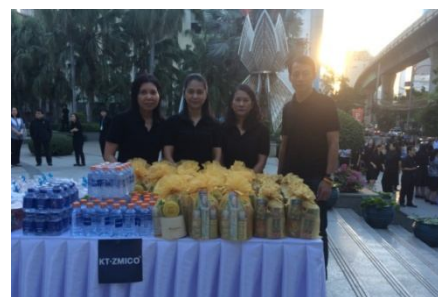
ทำบุญตักบาตรข้าวสารอาหารแห้ง ร่วมกับธนาคารกรุงไทย