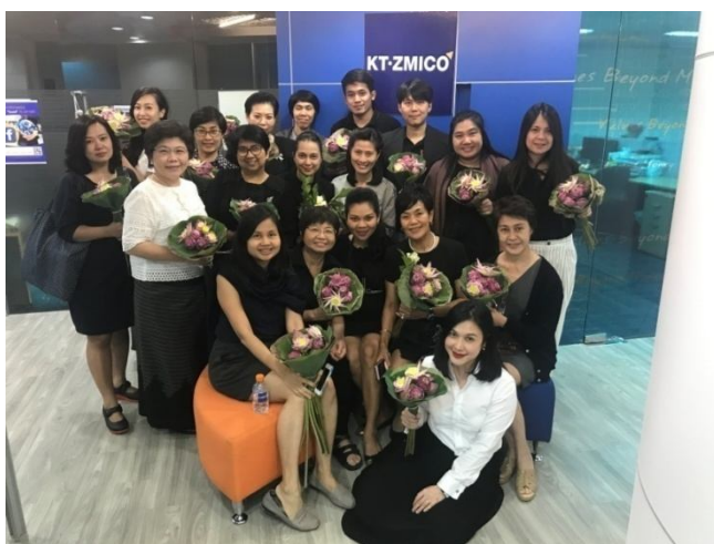
กิจกรรมพับกลีบบัวเจริญสติ

บริษัทฯ มีนโยบายการเสริมสร้างสุขภาวะที่ดีในองค์กร ทั้งทางด้านสุขภาพกายและสุขภาพใจ ให้พนักงานมีความสุขในการทำงาน และการดำรงชีวิต จึงจัดให้มีโครงการ Health & Wellbeing โดยในปี 2560 ได้จัดกิจกรรมพับกลีบบัวเจริญสติ ฝึกการพับกลีบบัวในแบบต่างๆ ควบคู่ไปกับการฝึกสติ ซึ่งสามารถนำมาปรับใช้กับการทำงานและการดำเนินชีวิตในด้านต่างๆ ได้อย่างมีสติและมีความสุข