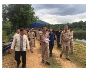
คณะผู้บริหารและภาคี เข้าเยี่ยมชมการดำเนินการขุดท่อ