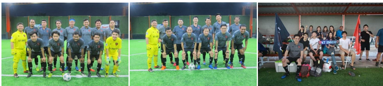
Singha Broker Cup 2017

บริษัทฯ สนับสนุนให้บุคลากรเล่นกีฬา ส่งเสริมนักกีฬาที่มีความสามารถให้เป็นตัวแทนบริษัทฯ ไปร่วมแข่งขันกีฬาระหว่างกลุ่มธุรกิจหลักทรัพย์ การแข่งขันกีฬาที่จัดเป็นประจำทุกปี ได้แก่ การแข่งขันฟุตบอล Singha Broker Cup การแข่งขันแบดมินตัน Broker Badminton Championship และการแข่งขันปิงปอง SET-Broker Table Tennis Championship ซึ่งการแข่งขันกีฬาต่างๆ ดังกล่าว เป็นการจัดขึ้นเพื่อกระชับความสัมพันธ์ระหว่างหน่วยงานในกลุ่มธุรกิจหลักทรัพย์และหน่วยงานที่เกี่ยวข้อง โดยใช้กีฬาเป็นสื่อกลาง ได้แก่ บริษัทสมาชิกในกลุ่มบริษัทหลักทรัพย์ สมาคมบริษัทหลักทรัพย์ไทย บริษัทสมาชิกชมรมผู้ประกอบการธุรกิจสัญญาซื้อขายล่วงหน้า ตลาดหลักทรัพย์แห่งประเทศไทย ตลาดสินค้าเกษตรล่วงหน้าแห่งประเทศไทย สมาคมบริษัทจดทะเบียนไทย สมาคมตราสารหนี้ไทย ชมรมนักข่าว และกองทุนบำเหน็จบำนาญข้าราชการ เป็นต้น การแข่งขันกีฬาถือเป็นกิจกรรมที่ส่งเสริมสุขภาพ และสร้างความสามัคคีระหว่างพนักงาน รวมถึงความสัมพันธ์ที่ดีระหว่างหน่วยงานด้วย