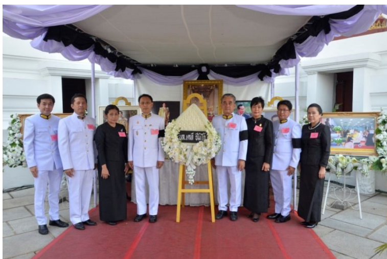
บริษัทฯ ร่วมเป็นเจ้าภาพบำเพ็ญพระราชกุศลสวดพระอภิธรรมพระบรมศพพระบาทสมเด็จพระปรมินทรมหาภูมิพลอดุลยเดช