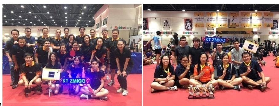
SET-Broker Table Tennis Championship 2017