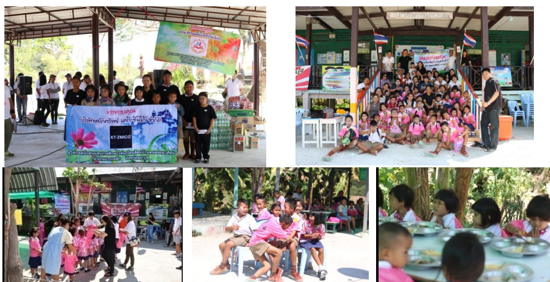
มอบทุนการศึกษา และจัดจิตอาสา ร่วมจัดกิจกรรมสันทนาการและเลี้ยงอาหารกลางวันแก่นักเรียน โรงเรียนบ้านหนองตอเตียน จ.สระบุรี