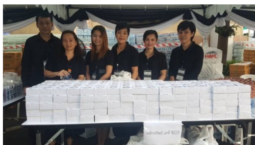
กิจกรรมจิตอาสาแจกอาหารและเครื่องดื่ม วันที่ 26 ตุลาคม 2560