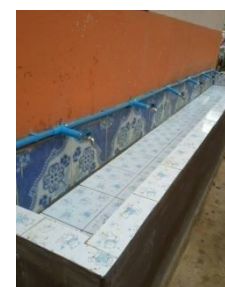
สภาพหลังซ่อมแซมห้องสุขาและปรับปรุงภูมิทัศน์โดยรอบให้สะอาดปลอดภัย