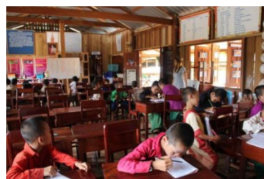
อาคารเรียนปัจจุบัน ศษ. บ้านมอตะหลั่ว อำเภออุ้มผาง จังหวัดตาก