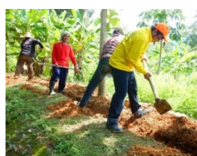
การขุดดินเพื่อวางท่อส่งน้ำ