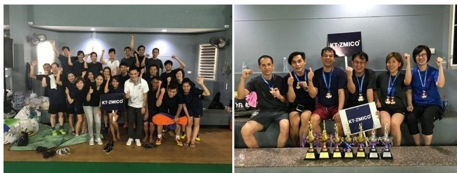
Broker Badminton Championship 2017