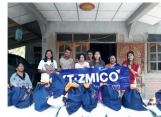
มอบถุงยังชีพให้ผู้ประสบอุทกภัย ในพื้นที่อำเภอชะอวด อำเภอทุ่งสง อำเภอเชียรใหญ่ จังหวัดนครศรีธรรมราช ในเดือนมกราคม 2560