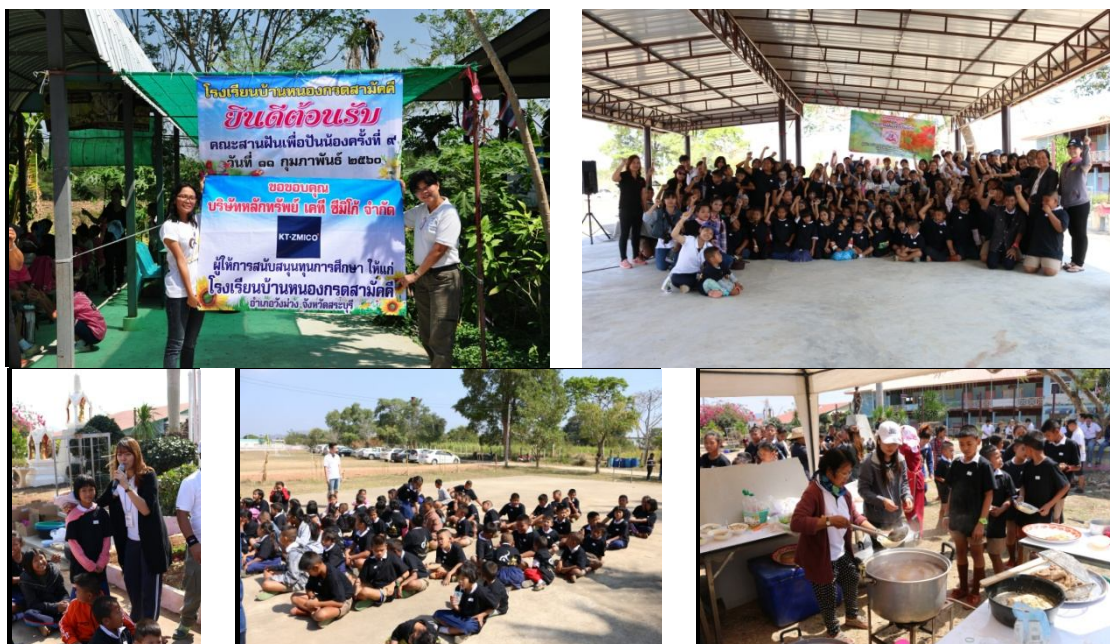
มอบทุนการศึกษา และจัดจิตอาสา ร่วมจัดกิจกรรมสันทนาการและเลี้ยงอาหารกลางวันแก่นักเรียน โรงเรียนบ้านหนองกรดสามัคคี จ.สระบุรี