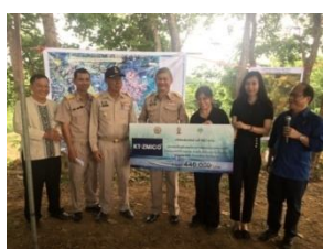
มอบเงินสนับสนุนโครงการ