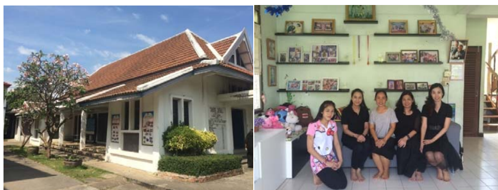
เยี่ยมชมหมู่บ้านเด็กโสสะ บางปู จังหวัดสมุทรปราการ และแม่โสสะผู้ให้การเลี้ยงดูเด็กๆ