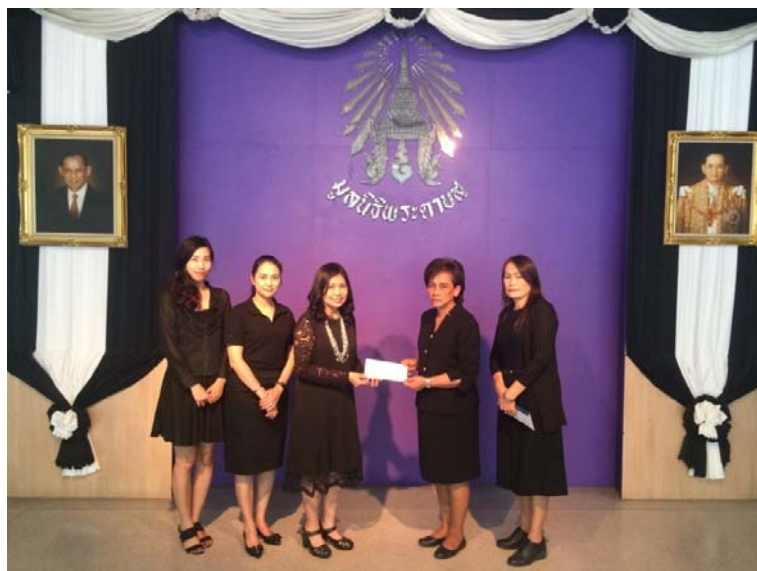
บริษัทฯ มอบเงินสนับสนุนเพื่อการดำเนินงานของมูลนิธิ และเพื่อเป็นทุนการศึกษาให้กับนักเรียนโรงเรียนพระดาบส

บริษัทฯ ได้จัดตั้งกองทุนการศึกษาเพื่อศิษย์พระดาบส ขึ้นเมื่อปี พ.ศ. 2556 โดยมีวัตถุประสงค์เพื่อสนับสนุนการดำเนินงานของมูลนิธิและโรงเรียน รวมถึงเพื่อเป็นทุนการศึกษาให้นักเรียนอย่างต่อเนื่อง ซึ่งในปีนี้ บริษัทฯ ได้สมทบทุนเข้ากองทุนดังกล่าวสำหรับโรงเรียนพระดาบส กรุงเทพมหานคร และโรงเรียนพระดาบส จังหวัดชายแดนภาคใต้ เพื่อช่วยเหลือผู้ด้อยโอกาสทางการศึกษาให้มีโอกาสศึกษาเล่าเรียนด้านวิชาชีพจนจบหลักสูตร สามารถเป็นที่พึ่งของตนเอง ครอบครัว ชุมชนและประเทศชาติได้ต่อไป