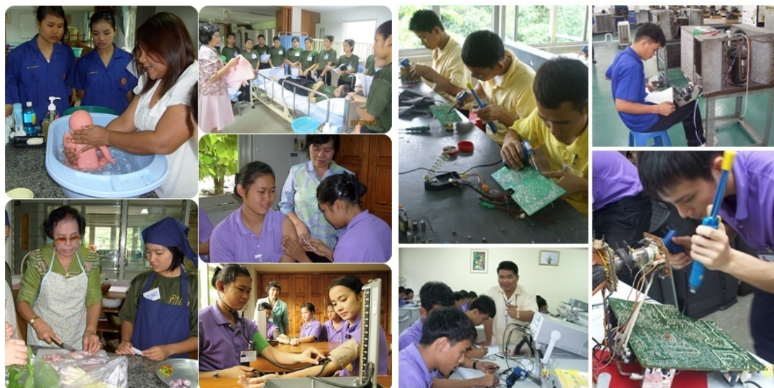
หลักสูตรต่างๆ ที่เปิดสอนในโรงเรียนพระดาบส