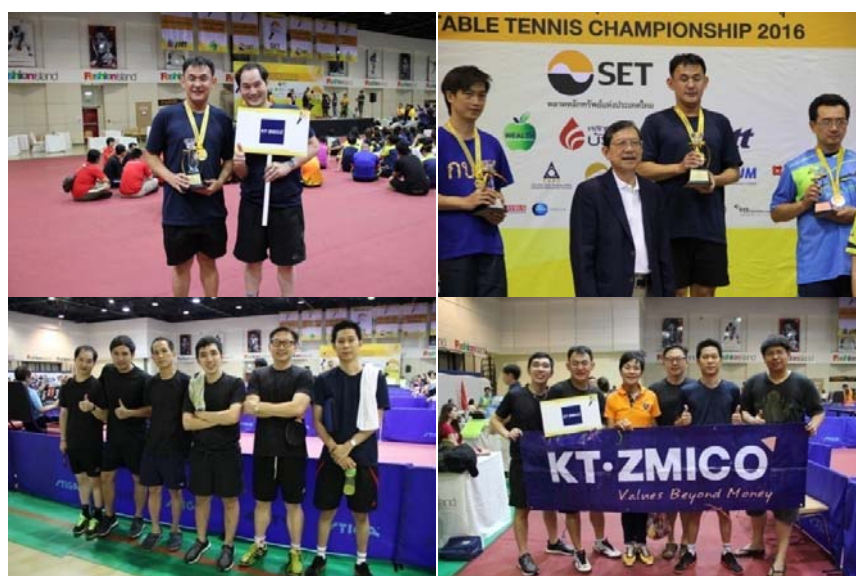
SET-Broker Table Tennis Championship