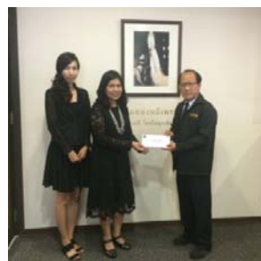
บริษัทฯ มอบเงินสนับสนุนเพื่อการดำเนินงานของมูลนิธิ