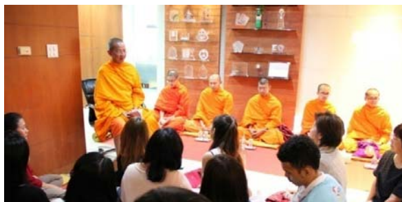
พิธีทำบุญบริษัทประจำปี 2559 และฟังการบรรยายธรรมจากพระราชวิจิตรปฏิภาณ