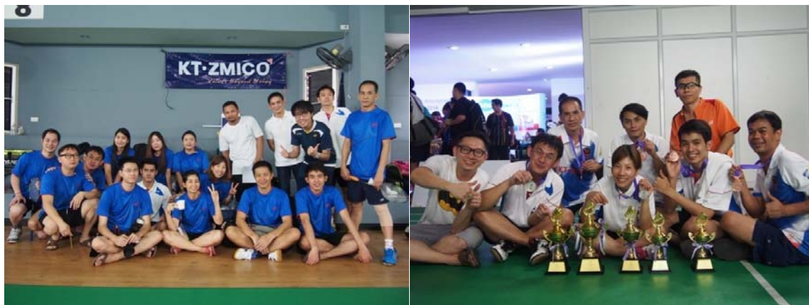
Broker Badminton Championship