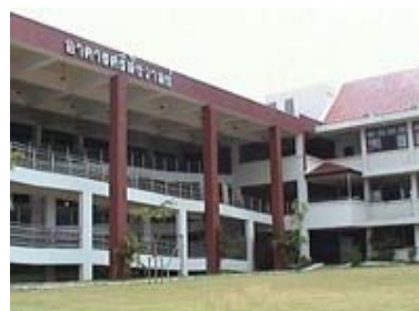
โรงเรียนศรีสังวาลย์