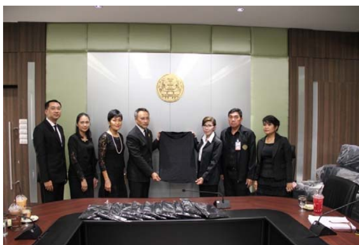
บริษัทฯ มอบเสื้อสีดำ จำนวน 10,000 ตัว ณ สำนักงานปลัดสำนักนายกรัฐมนตรี

บริษัทฯ จัดกิจกรรมเพื่อถวายเป็นพระราชกุศล และเพื่อแสดงความสำนึกในพระมหากรุณาธิคุณ พระบาทสมเด็จพระปรมินทรมหาภูมิพลอดุลยเดช ได้แก่ การมอบเสื้อสีดำจำนวน 10,000 ตัว ให้กับสำนักงาน ปลัดสำนักนายกรัฐมนตรี เพื่อนำไปแจกจ่ายให้กับประชาชนที่มีความขาดแคลน ไม่สามารถจัดหาเสื้อสีดำมาสวมใส่เพื่อไว้อาลัย และการบริจาคข้าวสาร อาหารแห้ง เครื่องปรุงอาหาร และน้ำดื่มให้กับศูนย์ประสานงานอาสาสมัคร Volunteers for Dad เพื่อให้บริการแก่ประชาชนที่เดินทางมาถวายสักการะพระบรมศพ ณ บริเวณสนามหลวง