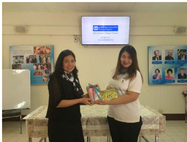
บริษัทฯ มอบเงินสนับสนุนเพื่อการดำเนินงานของมูลนิธิ

บริษัทฯ ร่วมสมทบทุนเพื่อสนับสนุนการดำเนินงานของมูลนิธิ ซึ่งมีการกึ่งในการช่วยเหลือเด็กกำพร้าโดยการสร้างครอบครัวทดแทนถาวร โดยเด็กจะได้รับการเลี้ยงดูในชุมชนหมู่บ้านเด็กที่จัดตั้งขึ้น ให้เติบโตในครอบครัวและสภาพแวดล้อมที่เหมาะสม เติบโตขึ้นเป็นผู้ใหญ่ที่มีคุณภาพและเป็นคนดีของสังคม