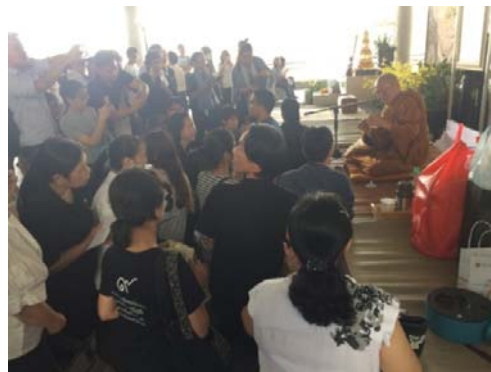
พนักงานร่วมทำวัตรเช้าและฟังธรรมกับพระอาจารย์ไพศาล วิสาโล ณ หอจดหมายเหตุพุทธทาส อินทปัญญ

นอกจากนี้ บริษัทฯ ยังมีส่วนร่วมในการส่งเสริมกิจกรรมทางศาสนาเพื่อให้พนักงานใช้เป็นแหล่งรวมจิตใจ สร้างความสามัคคี ในองค์กร และอนุรักษ์ประเพณีและวัฒนธรรมอันดีงามให้อยู่คู่กับคนไทย เช่น ประเพณีวันสงกรานต์ และประเพณีทางพระพุทธศาสนาต่างๆ โดยร่วมเป็นเจ้าภาพกับธนาคารกรุงไทย จำกัด (มหาชน) ในงานทอดกฐินสามัคคีประจำปี 2559 เพื่อนำรายได้สมทบทุนในการสร้างห้องพัสดุปฏิบัติวิปัสสนากรรมฐาน ณ ศูนย์วิปัสสนาสากลไร่เชิญตะวัน โดยพระมหาวิศิษฐ์ วชิรเมธี (ท่าน ว.วชิรเมธี) จังหวัดเชียงราย นอกจากนี้ ยังได้ร่วมเป็นเจ้าภาพงานทอดกฐินประจำปีและงานทอดผ้าป่ากับหน่วยงานต่างๆ อาทิเช่น สำนักงานป้องกันและปราบปรามการฟอกเงิน และสำนักงานประกันสังคม เป็นต้น