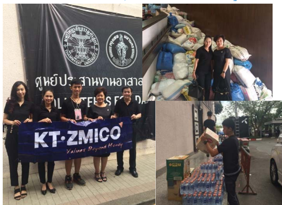
กิจกรรมมอบข้าวสาร อาหารแห้ง และน้ำดื่ม ณ ศูนย์ประสานงานอาสาสมัคร มหาวิทยาลัยธรรมศาสตร์