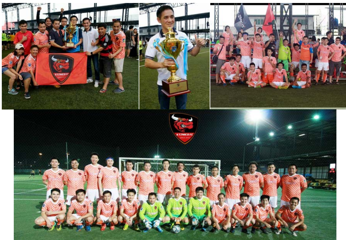
Singha Broker Cup

บริษัทฯ สนับสนุนให้บุคลากรเล่นกีฬา ส่งเสริมนักกีฬาที่มีความสามารถให้เป็นตัวแทนบริษัทฯ ไปร่วมแข่งขันกีฬาระหว่างกลุ่มธุรกิจหลักทรัพย์ การแข่งขันกีฬาที่จัดเป็นประจำทุกปี ได้แก่ การแข่งขันฟุตบอล Singha Broker Cup การแข่งขันแบดมินตัน Broker Badminton Championship และการแข่งขันปิงปอง SET-Broker Table Tennis Championship ซึ่งการแข่งขันกีฬาต่างๆ ดังกล่าว เป็นการจัดขึ้นเพื่อกระชับความสัมพันธ์ระหว่างหน่วยงานในกลุ่มธุรกิจหลักทรัพย์และหน่วยงานที่เกี่ยวข้อง โดยใช้กีฬาเป็นสื่อกลาง ได้แก่ บริษัทสมาชิกในกลุ่มบริษัทหลักทรัพย์ สมาคมบริษัทหลักทรัพย์ไทย บริษัทสมาชิกชมรมผู้ประกอบการธุรกิจสัญญาซื้อขายล่วงหน้า ตลาดหลักทรัพย์แห่งประเทศไทย ตลาดสินค้าเกษตรล่วงหน้าแห่งประเทศไทย สมาคมบริษัทจดทะเบียนไทย สมาคมตราสารหนี้ไทย ชมรมนักข่าว และกองทุนบำเหน็จบำนาญข้าราชการ เป็นต้น การแข่งขันกีฬาถือเป็นกิจกรรมที่ส่งเสริมสุขภาพ และสร้างความสามัคคีระหว่างพนักงาน รวมถึงความสัมพันธ์ที่ดีระหว่างหน่วยงานด้วย