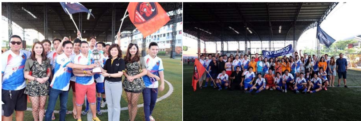
Singha Broker Cup

ใช้กีฬาเป็นสื่อกลาง เช่น บริษัทสมาชิกในกลุ่มบริษัทหลักทรัพย์ สมาคมบริษัทหลักทรัพย์ไทย บริษัทสมาชิกชมรมผู้ประกอบการธุรกิจสัญญาซื้อขายล่วงหน้า ตลาดหลักทรัพย์แห่งประเทศไทย ตลาดสินค้าเกษตรล่วงหน้าแห่งประเทศไทย สมาคมบริษัทจดทะเบียนไทย สมาคมตราสารหนี้ไทย ชมรมนักข่าวและกองทุนบำเหน็จบำนาญข้าราชการ เป็นต้น การแข่งขันกีฬาถือเป็นกิจกรรมที่ส่งเสริมสุขภาพ และสร้างความสามัคคีระหว่างพนักงาน รวมถึงความสัมพันธ์ที่ดีระหว่างหน่วยงานด้วย