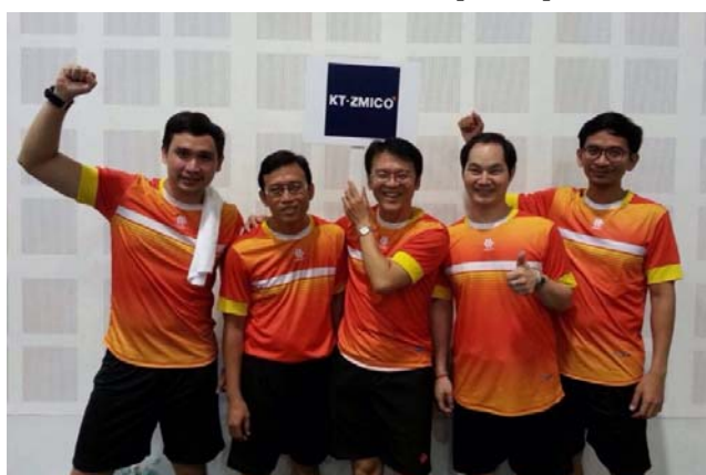
SET-Broker Table Tennis Championship