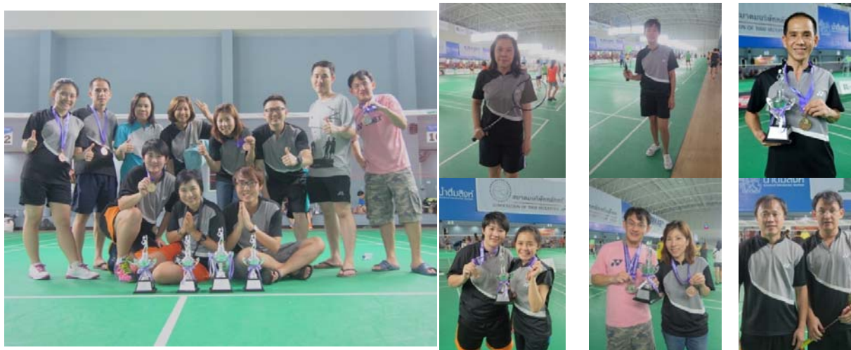
Broker Badminton Championship