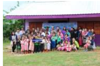
พิธีส่งมอบอาคารเรียน 11 ส.ค. 2561