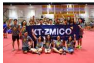
SET-Broker Table Tennis Championship 2018