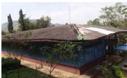
สภาพก่อนปรับปรุง

นอกจากนี้ บริษัทฯ ได้สนับสนุนงบประมาณให้กับโรงเรียนวัดพุ่มบำเพ็ญธรรม จังหวัดอุทัยธานี เพื่อปรับปรุงซ่อมแซมหลังคาอาคารเรียนที่ชำรุดทรุดโทรมและไม่ปลอดภัยในการใช้งาน