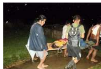
ความทุรกันดารและระยะทางที่ห่างไกล เป็นอุปสรรคในการเข้าถึงการรักษาพยาบาลของประชาชน