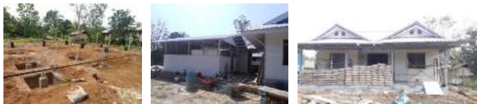
ระหว่างการก่อสร้างอาคารเอกประสงค์ และอาคารสุศาลาบ้านยูไนท์ คาดว่าจะเสร็จในปี 2562

นอกจากนี้ ในปี 2561 บริษัทฯ ยังได้สนับสนุนงบประมาณเพิ่มเติมในการก่อสร้างอาคารสุศาลา เพื่อใช้เป็นสถานที่สำหรับการรักษาผู้ป่วย และเป็นเครือข่ายสุขภาพในพื้นที่ ซึ่งเมื่อสร้างเสร็จแล้ว จะมีบุคลากรทางการแพทย์และเจ้าหน้าที่สาธารณสุขมาประจำเพื่อให้บริการตรวจรักษาชาวบ้าน หรือให้การรักษายาบาลเบื้องต้นที่จำเป็นสำหรับผู้ป่วยที่เดินทางมาจากพื้นที่ห่างไกล ก่อนส่งตัวผู้ป่วยไปรักษาต่อที่โรงพยาบาลอุ้มผางในอำเภอเมือง