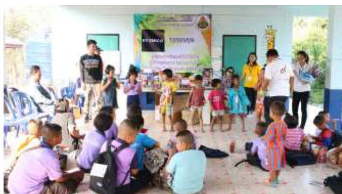
จิตอาสา ร่วมกิจกรรมสานฝันการและมอบอุปกรณ์การเรียนการสอนให้เด็กนักเรียน รร.บ้านใหม่ร่มเย็น

บริษัทฯ ร่วมสนับสนุนในโครงการสานฝันเพื่อปันน้ำใจ ซึ่งดำเนินการโดยกลุ่มจิตอาสาอิสระ ก่อตั้งขึ้นเพื่อให้ความช่วยเหลือกับเด็กนักเรียนในโรงเรียนที่ขาดแคลน บริษัทฯ ได้มอบเงิน สมทบเพื่อจัดซื้ออุปกรณ์การเรียนการสอน อุปกรณ์กีฬา และเครื่องแต่งกายให้กับนักเรียน โรงเรียนบ้านใหม่ร่มเย็น จังหวัดอุทัยธานี โดยมีจิตอาสา ร่วมกิจกรรมสานฝันการและเลี้ยงอาหาร กลางวันแก่เด็กๆ ด้วย