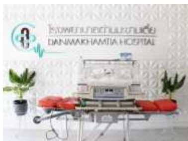
เครื่องกระตุ้นหัวใจด้วยไฟฟ้า