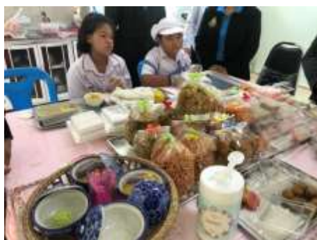
ห้องคหกรรม