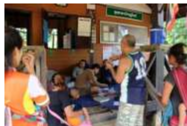
บ้านยูไนท์ เป็นหมู่บ้านกะเหรี่ยงกลางป่าทุ่งใหญ่นเรศวร ชาวบ้านมีฐานะยากจน