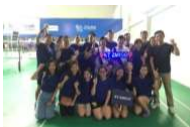
Broker Badminton Championship 2018