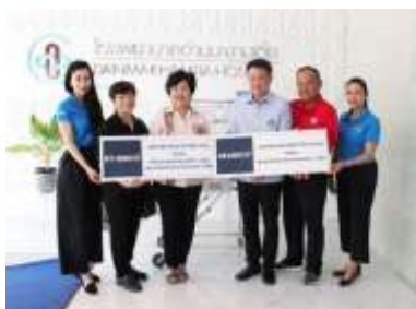
พิธีมอบอุปกรณ์ทางการแพทย์

บริษัทฯ สนับสนุนงบประมาณในการจัดซื้ออุปกรณ์ทางการแพทย์ ให้กับโรงพยาบาลด่านมะขามเตี้ย อำเภอด่านมะขามเตี้ย จังหวัดกาญจนบุรี ได้แก่ เครื่องกระตุ้นหัวใจด้วยไฟฟ้า และตู้อบลำเลียงสำหรับเด็กทารกแรกเกิด เพื่อให้ความช่วยเหลือทางด้านอุปกรณ์การแพทย์ที่ขาดแคลน ให้ผู้ป่วยได้รับการรักษาและช่วยชีวิตอย่างทันท่วงที