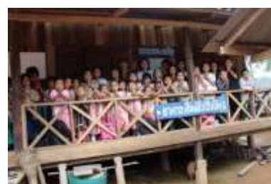
อาคารเรียนหลังที่ 1 ศศช.บ้านมอตะหลั่ว อ.อุ้มผาง จ.ตาก