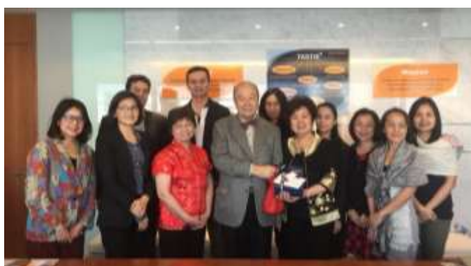
บริษัทฯ ร่วมมือกับมูลนิธิมิชชั่นวิระไวทยะ ในโครงการโรงเรียนร่วมพัฒนา

ในปี 2561 บริษัทฯ ได้เข้าร่วมโครงการภายใต้การดูแลของมูลนิธิมิชชั่นวิระไวทยะ และพิจารณาคัดเลือกโรงเรียนจากโรงเรียนต่างๆ ทั่วประเทศที่สนใจเข้าร่วมโครงการ โดยจะเริ่มดำเนินการตั้งแต่ปี 2562 เป็นต้นไป เป็นระยะเวลา 3 ปี