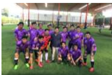
Singha Broker Cup

บริษัทฯ สนับสนุนให้บุคลากรเล่นกีฬา ส่งเสริมนักกีฬาที่มีความสามารถให้เป็นตัวแทนบริษัทฯ ไปร่วมแข่งขันกีฬาระหว่างกลุ่มธุรกิจหลักทรัพย์ การแข่งขันกีฬาที่จัดเป็นประจำทุกปี ได้แก่ การแข่งขันฟุตบอล Singha Broker Cup การแข่งขันแบดมินตัน Broker Badminton Championship และการแข่งขันปิงปอง SET-Broker Table Tennis Championship ซึ่งการแข่งขันกีฬาต่างๆ ดังกล่าว เป็นการ จัดขึ้นเพื่อกระชับความสัมพันธ์ระหว่างหน่วยงานในกลุ่มธุรกิจหลักทรัพย์และหน่วยงานที่เกี่ยวข้อง โดยใช้กีฬาเป็นสื่อกลาง ได้แก่ บริษัทสมาชิกในกลุ่มบริษัทหลักทรัพย์ สมาคมบริษัทหลักทรัพย์ไทย บริษัทสมาชิกชมรมผู้ประกอบการธุรกิจสัญญาซื้อขายล่วงหน้า ตลาดหลักทรัพย์แห่งประเทศไทย ตลาดสินค้าเกษตรล่วงหน้าแห่งประเทศไทย สมาคมบริษัทจดทะเบียนไทย สมาคมตราสารหนี้ไทย ชมรม นักข่าวและกองทุนบำเหน็จบำนาญข้าราชการ เป็นต้น การแข่งขันกีฬาถือเป็นกิจกรรมที่ส่งเสริม สุขภาพ และสร้างความสามัคคีระหว่างพนักงาน รวมถึงความสัมพันธ์ที่ดีระหว่างหน่วยงานด้วย