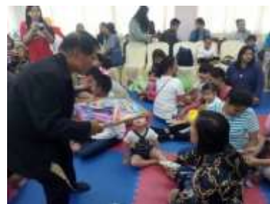
กิจกรรมวันขึ้นปีใหม่และวันเด็กแห่งชาติ ศูนย์การศึกษาพิเศษ ประจำจังหวัดนนทบุรี 12 ม.ค. 2561