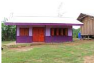
อาคารเรียนเด็กเล็ก (หลังสร้าง)